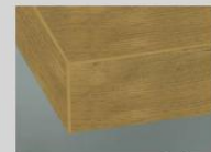
DK Kante in Frontfarbe