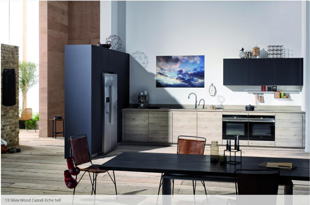
13 Silvia Wood Castell Eiche hell