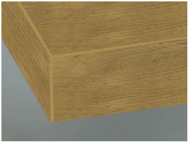
DK Kante in Frontfarbe