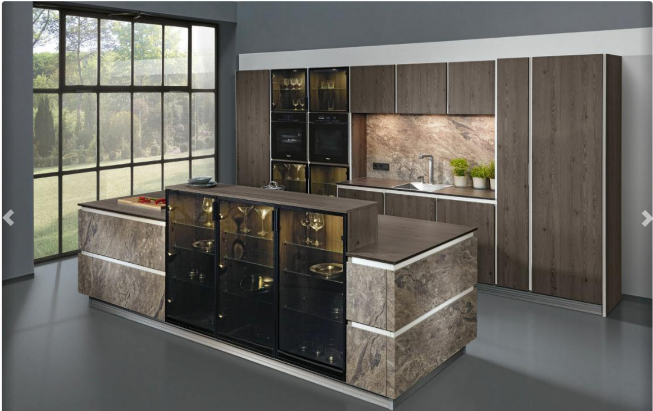
76 Paradiso XTreme Marmor Grau & 73 Tessina Line Lärche Anthrazit