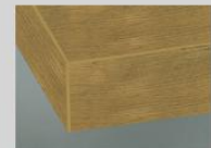
DK Kante in Frontfarbe