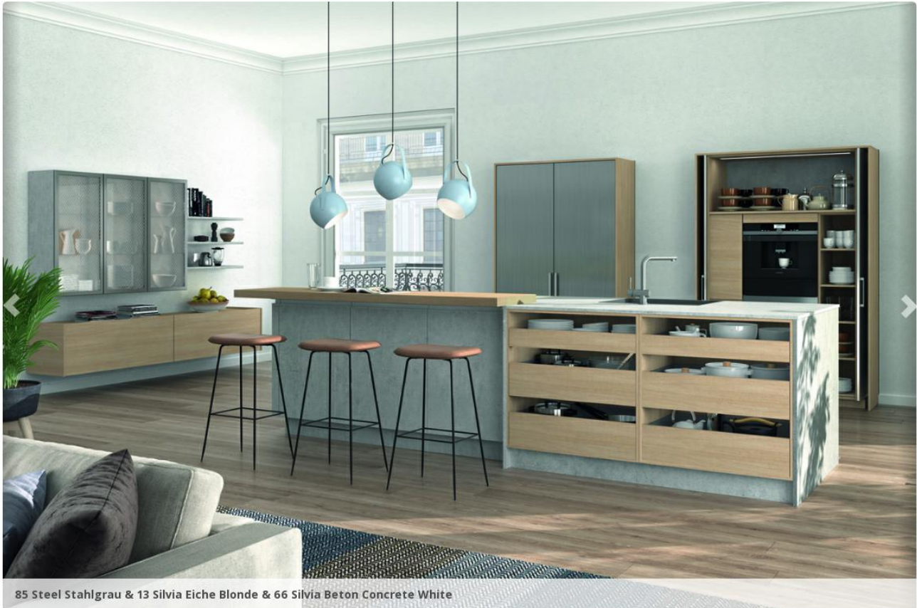
85 Steel Stahlgrau & 13 Silvia Eiche Blonde & 66 Silvia Beton Concrete White