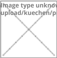
Image type unknown upload/kuechen/pro Image type unknown upload/kuechen/programme/