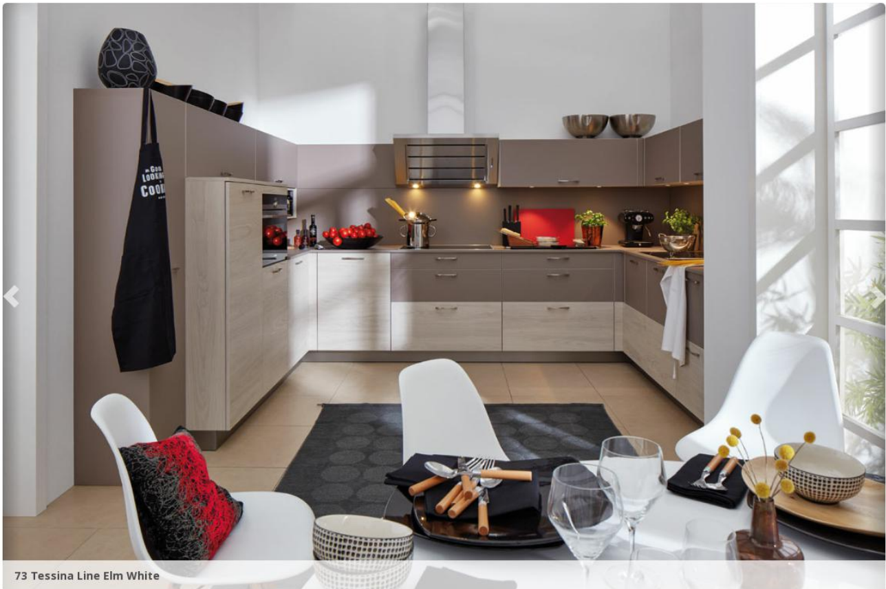
73 Tessina Line Elm White