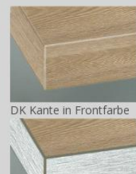
DK Kante in Frontfarbe