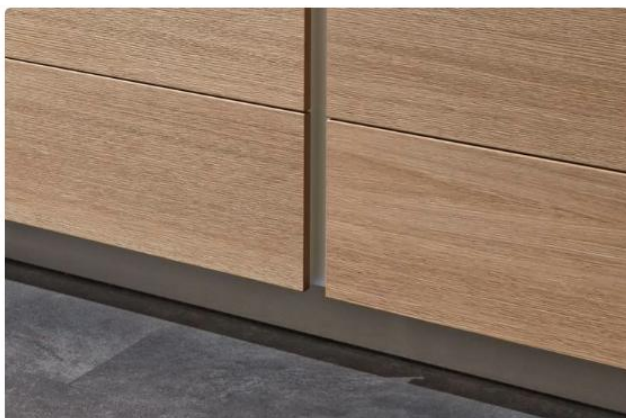
Trendline Métallisé 1 Profilé poignée inox.

Avec la cuisine sans poignées, vous passez la main derrière la façade pour l'ouvrir. Une petite poignée coquille, invisible depuis le côté extérieur de la façade, est fraisée dans ce but, à une hauteur ergonomique. Une technique aboutie dans les moindres détails : avec notre solution verticale, la baguette installée entre deux armoires colonnes dissimule le chant avant du caisson.