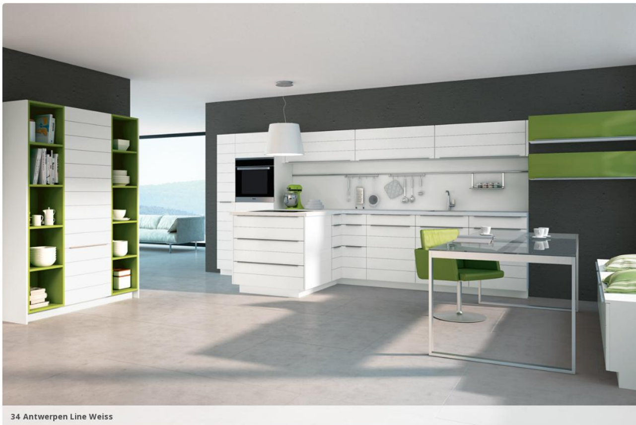
34 Antwerpen Line Weiss